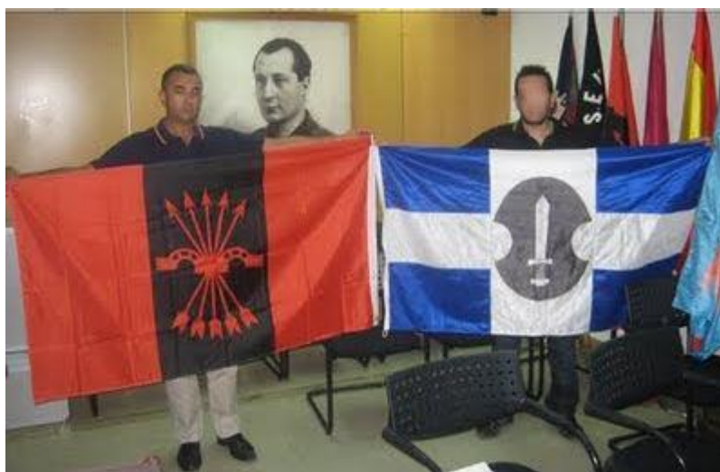
Επίσημη συνάντηση ΕΛΑΜ με το νέο-φασιστικό Ισπανικό κόμμα Falange.